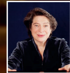
Elisabeth Leonskaja - Klavier